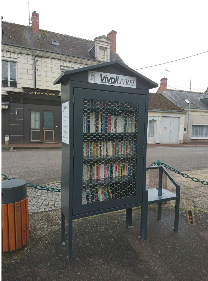
Boîte "VivaLLivres" de Noyers-sur-Cher