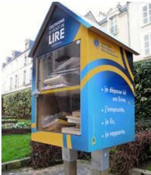
Modèle de boîte mis à disposition par le Lions club à Blois