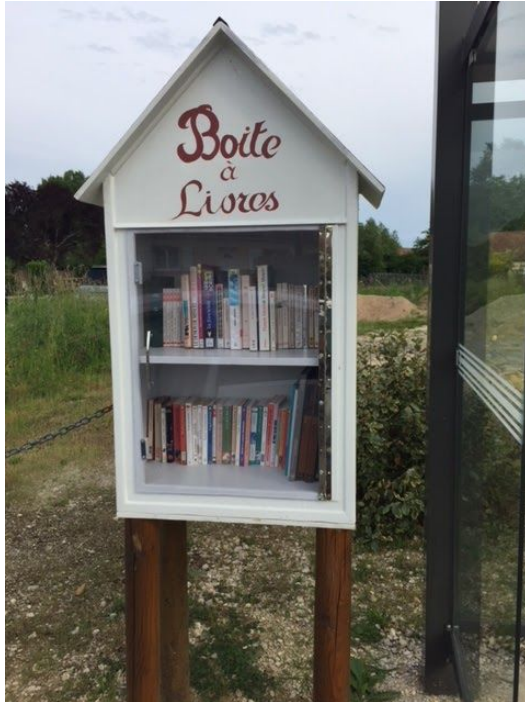
Boîte à livres de Chambon-sur-Cisse

Pour vous inspirer, voici quelques exemples de boîtes à livres implantées en Loir-et-Cher.