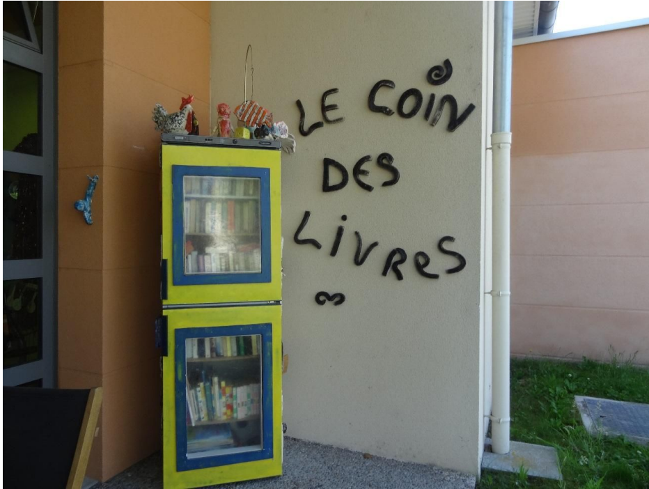
Le coin des livres de la Chrysalide à Vineuil