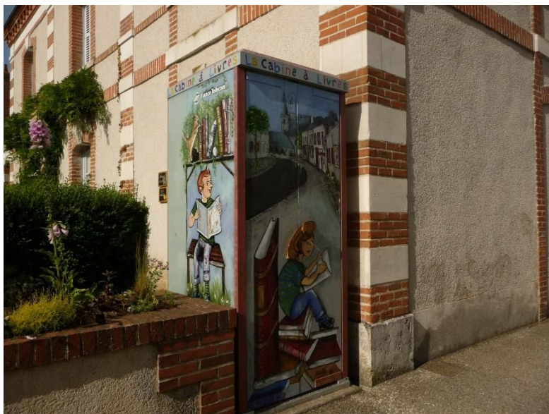
Cabine à Livres de Cheverny